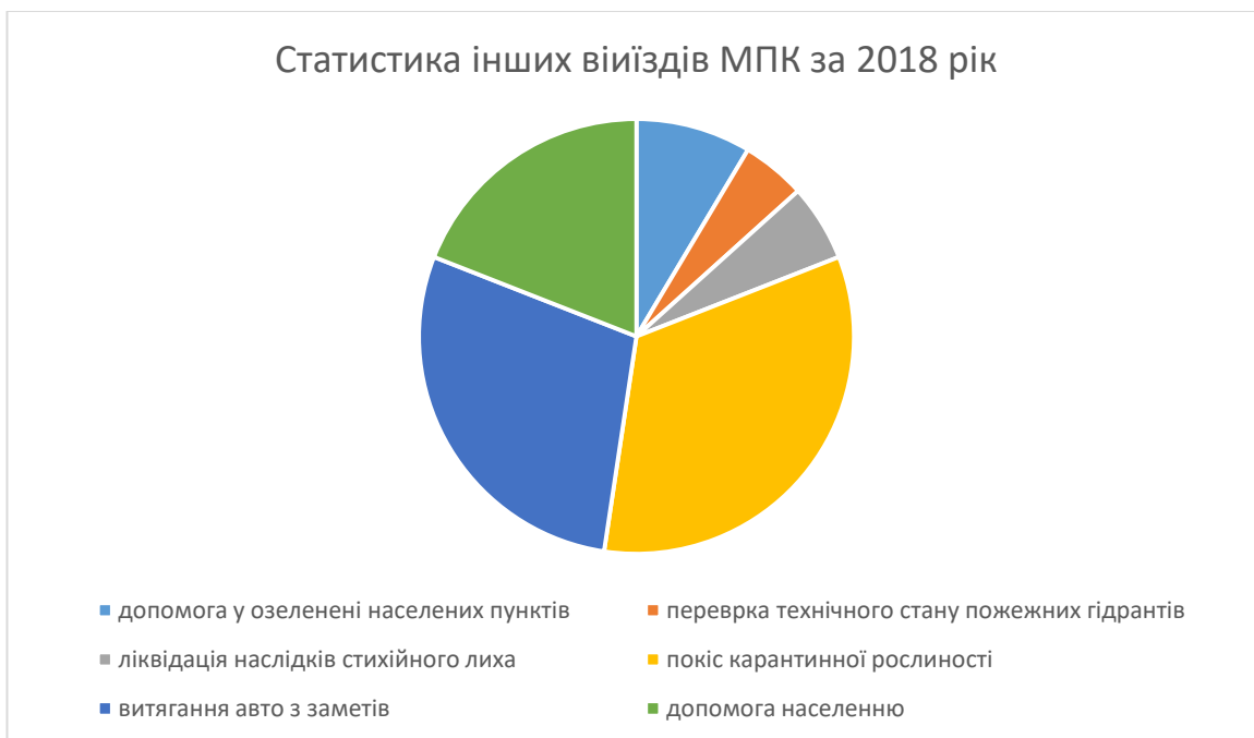
Статистика інших виїздів МПК за 2018 рік

Для підвищення ефективності роботи та створення належних умов праці працівників пожежної команди придбано автомобільну радіостанцію, 2 рації та приладдя до них, пожежні рукава, рятувальні мотузки, спецодяг та взуття та інше рятувальне спорядження.